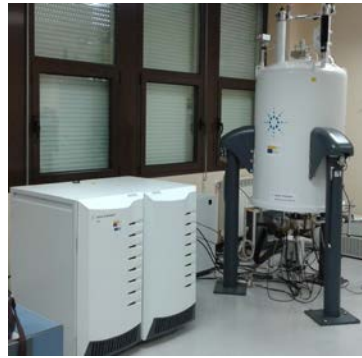
Espectrómetro de RMN 500 MHz