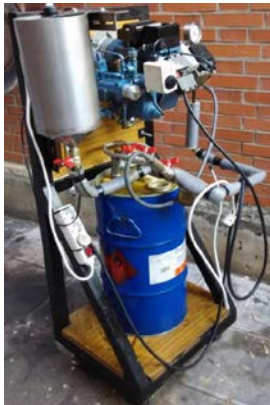
Sistema de alimentación de combustible